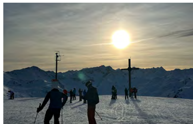
Abendlicher Ausblick am Gipfel der Axamer Lizum.