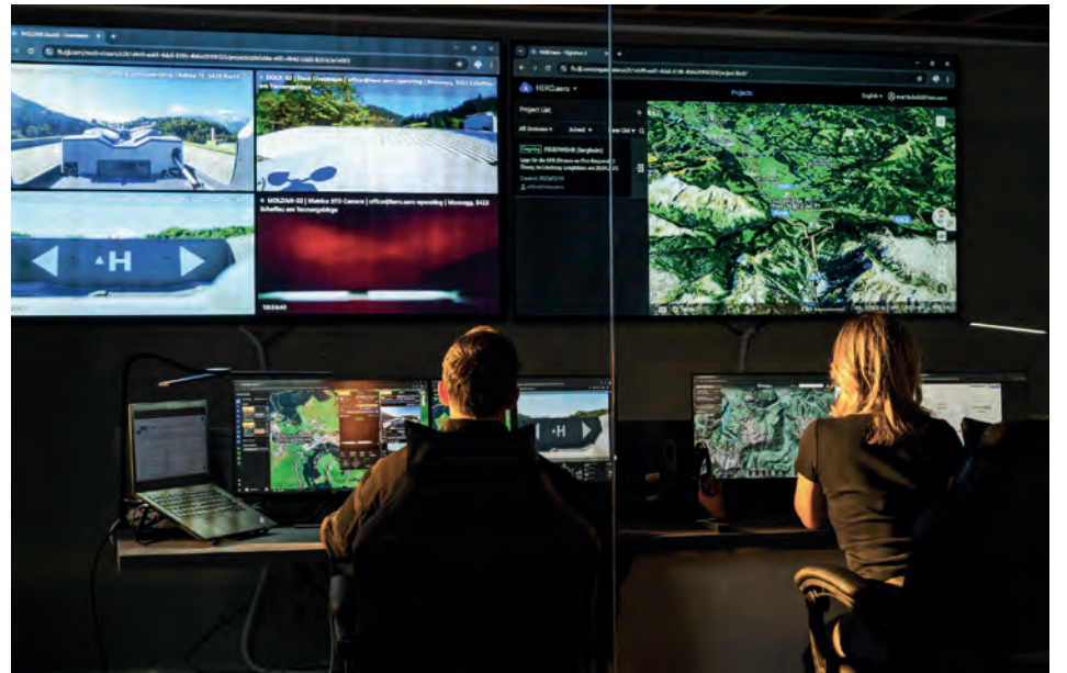
Vom Leitstand aus werden Drohnenstarts, Flugrouten und Funktionen überwacht und gesteuert.

Piloten (BVLOS) und liefert präzise 3D-Daten zu Gleisanlagen, Vegetation und umliegender Infrastruktur. Die Technologie erlaubt es, auch schwer zugängliche Streckenabschnitte effizient und sicher zu überwachen, ohne den regulären Bahnverkehr zu beeinträchtigen. Die Partnerschaft