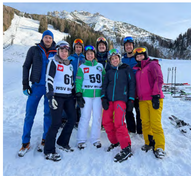
Die Landesgruppe Steiermark mit JI-Bundesvorsitzender Julia Aichhorn beim traditionellen Skirennen.

Die Tage in der Axamer Lizum haben einmal mehr gezeigt, wie wichtig solche Formate für die Junge Industrie sind: Sie schaffen Raum für Begegnung, stärken das Netzwerk und verbinden fachlichen Austausch mit gemeinsamen Erlebnissen. Die Vorfreude auf das nächste JI-Skiwochenende in der Steiermark ist damit bereits geweckt!