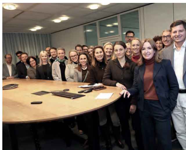
Treffpunkt am Redaktionstisch der „Salzburger Nachrichten“ für das PR-Forum der Industrie.

Das PR-Forum zeigte eindrucksvoll, wie wertvoll der direkte Austausch zwischen Industrie und Medien ist. Ein vertieftes Verständnis journalistischer Arbeitsweisen schafft nicht nur Transparenz, sondern auch die Basis für eine vertrauensvolle, souveräne und effiziente Zusammenarbeit.