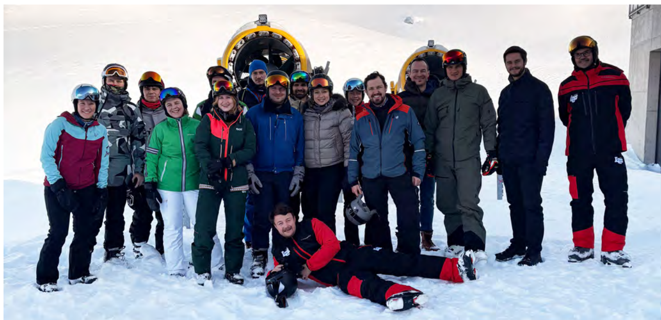
Einige Teilnehmerinnen und Teilnehmer aus ganz Österreich im Rahmen des JI-Skiwochenendes 2026.