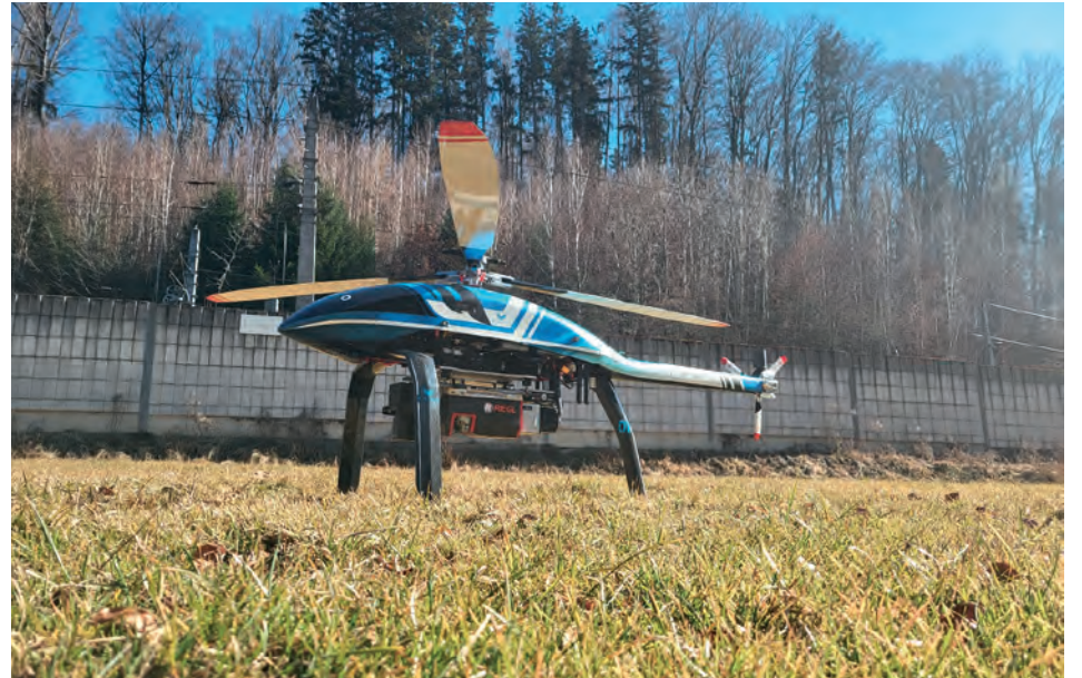
Das Drohnenmodell Velos Rotors V3 wurde speziell für die Industrie entwickelt.

Das Projekt ermöglicht automatisierte Befliegungen außerhalb der Sichtweite des