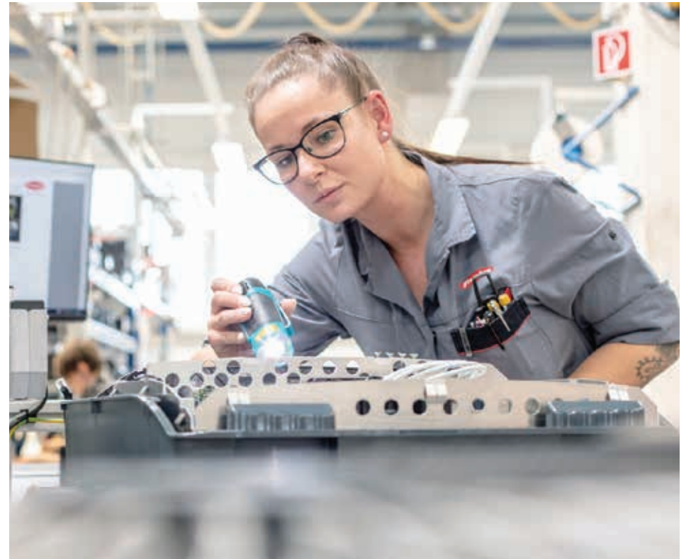
In der Industrie ist der Bedarf an hoch qualifizierten Mitarbeiterinnen und Mitarbeitern hoch.