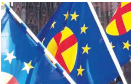
Die Fahnen der Paneuropa-Bewegung.

Europa untergräbt aus Angst vor seinen eigenen Bürgern seine Glaubwürdigkeit und internationale