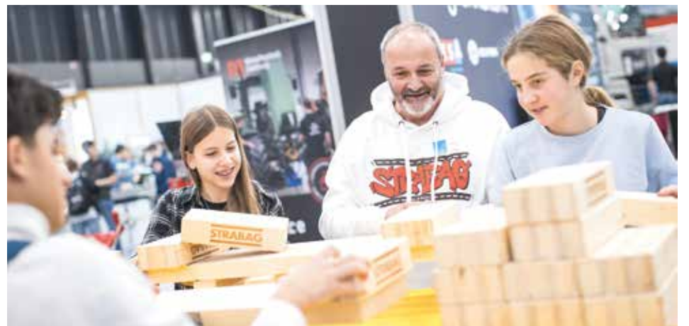
Die Baumeister von morgen konnten ihr Geschick bei der Strabag beweisen.