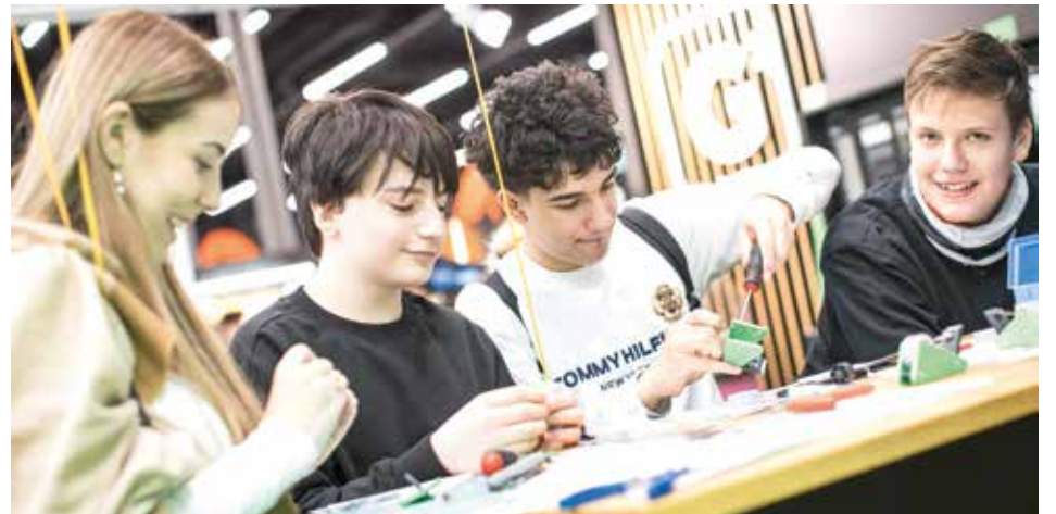
Bei GRASS wurden praktische Tixoroller gefertigt.

Das Lehrstellenverzeichnis der Salzburger Industrie wird für die BIM jährlich produziert; es enthält neben den angebotenen Lehrstellen für das kommende Jahr in den jeweiligen Betrieben auch die aktuellen Kontakte zu den Unternehmen. Im Rahmen des S-Pass-Gewinnspiels in Zusammenarbeit mit MINT Salzburg und Akzente Salzburg winkten tolle Preise wie eine Canyoning-Tour, Lasertag-Gutscheine oder eine Technik-Führung im Red Bull-Stadion, gesponsert von unseren Industriebetrieben. Während der vier Messtage besuchten rund 30.000 Interessierte die BIM im Messezentrum Salzburg. Diese Begegnungszone zwischen Unternehmern und Jugendlichen auf der Suche nach dem passenden Berufsweg präsentierte sich einmal mehr sehr ansprechend – und ist wichtiger denn je.