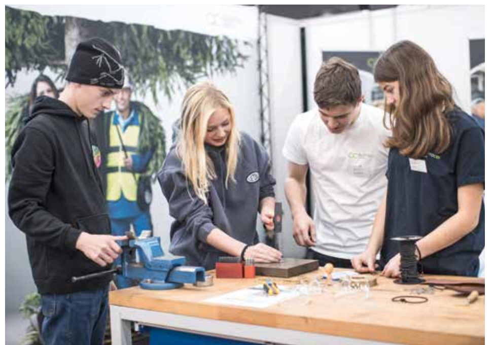
Bei AustroCel konnte ein Armband mit Namen graviert werden.