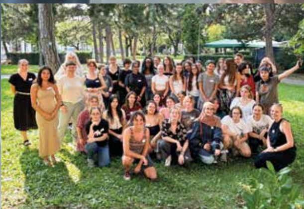
„GROW & GLOW“ Initiative holt Mädchen an die HTL

Wie Industriestandort UND Budget auf Vordermann gebracht werden können