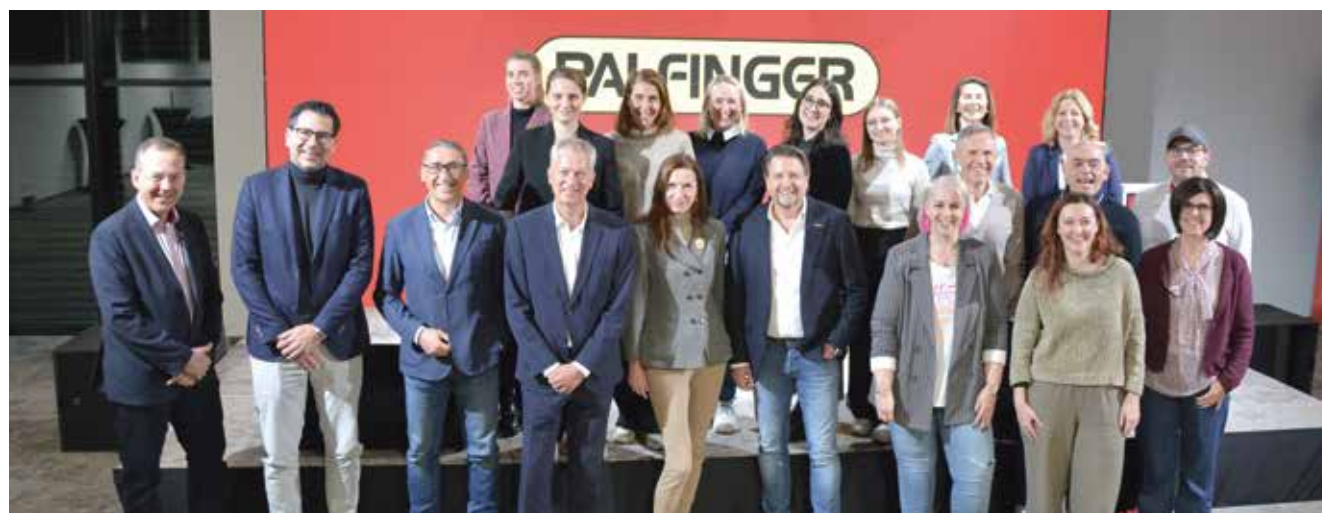
Das PR-Forum der Industrie erkundet die PALFINGER World.