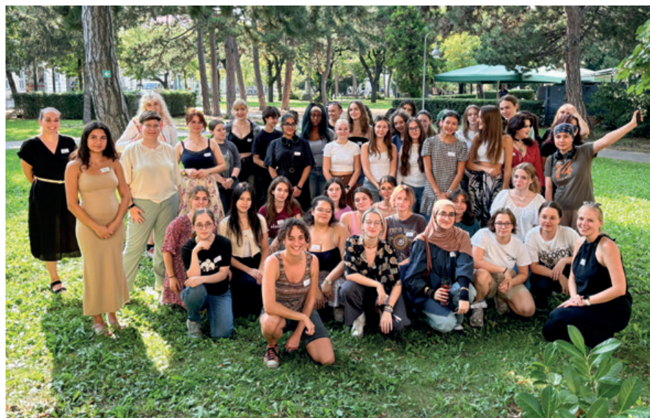
HTL-Schülerinnen aus „HTL-Girls Grow & Glow“.

So wurde auf Initiative der IV ein Kooperationsprojekt mit der MINTality-Stiftung, dem HTL-Direktorenverband und HTL-Schülerinnen gestartet. Ziel von „HTL-Girls Grow & Glow“ ist es, interessierte HTLs durch gezielte Interventionen stärker zu „Schulen der Mädchen“ zu machen und damit künftig mehr interessierte weibliche Talente anzuziehen. Operativ unterstützt durch die MINTality-Stiftung wird die HTL dabei in einer ersten Phase von ihren eigenen Schülerinnen unter die Lupe genommen: Wer oder was hat die Schulwahl beeinflusst? Wie wird das