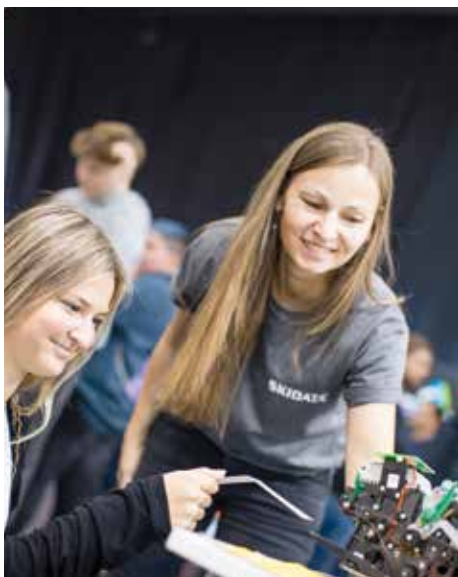
Wie Ticketing funktioniert, zeigte Skidata interessierten Besuchern auf seinem Messestand.