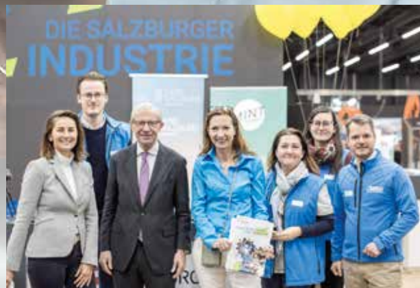
SALZBURG Einblicke in die Berufswelt der Industrie