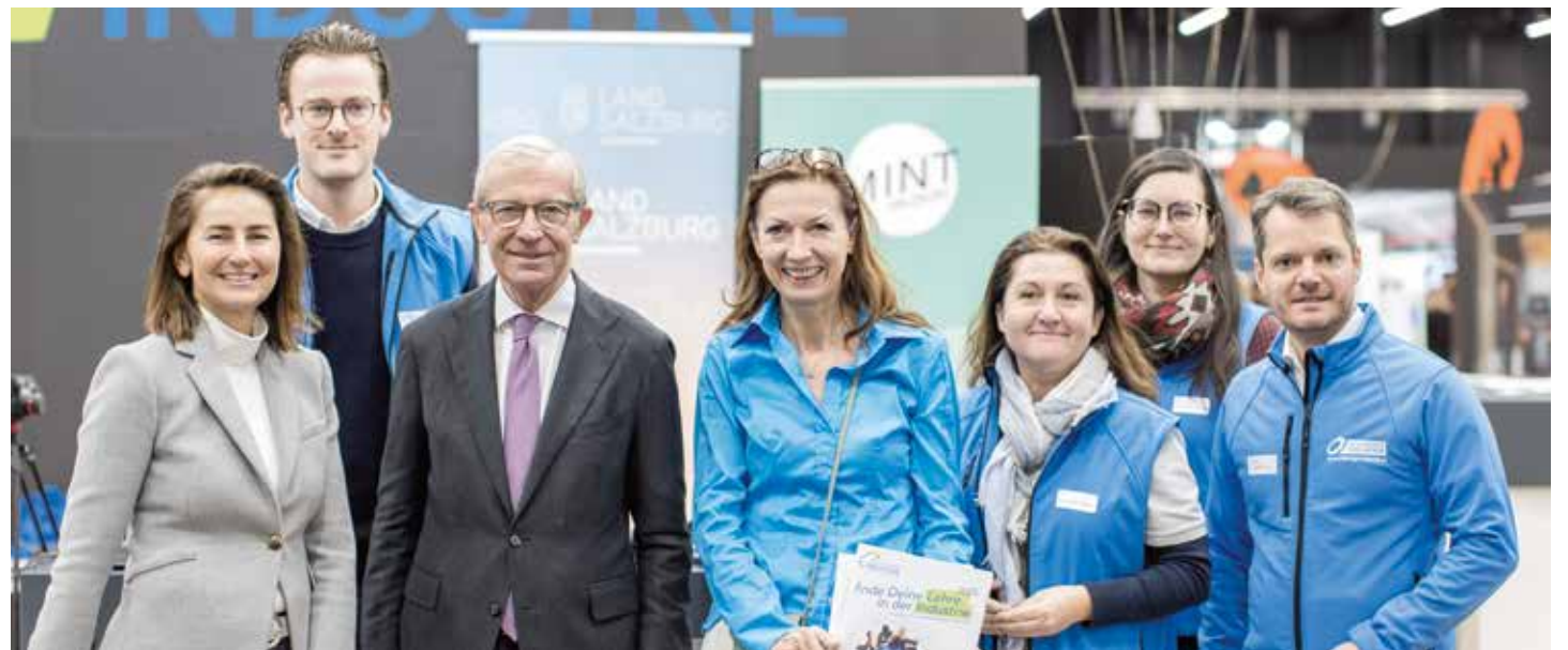
LH Wilfried Haslauer besuchte bei seinem Rundgang auf der BIM 2024 natürlich auch das „Industrieviertel“.