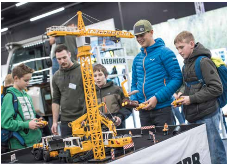
Liebherr-Radlader von Hand steuern (wenn auch nur die Miniaturausgaben): Dafür war das Interesse groß.